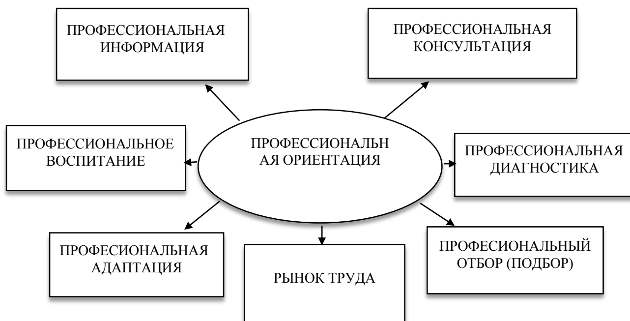
Рис. 2. Профессиональная ориентация

Направления профессиональной ориентации представлены на схеме рис. 2.