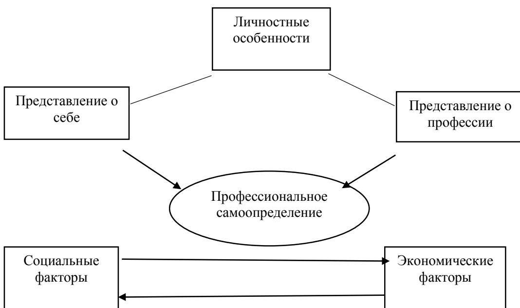
Рис. 1 Профессиональное самоопределении.

На схеме (рис. 1) представлены основные компоненты профессионального самоопределения, где можно увидеть, как связаны личностные представления о себе с социумом, а профессиональные интересы зависят не только от развития общества, но и от состояния экономики.